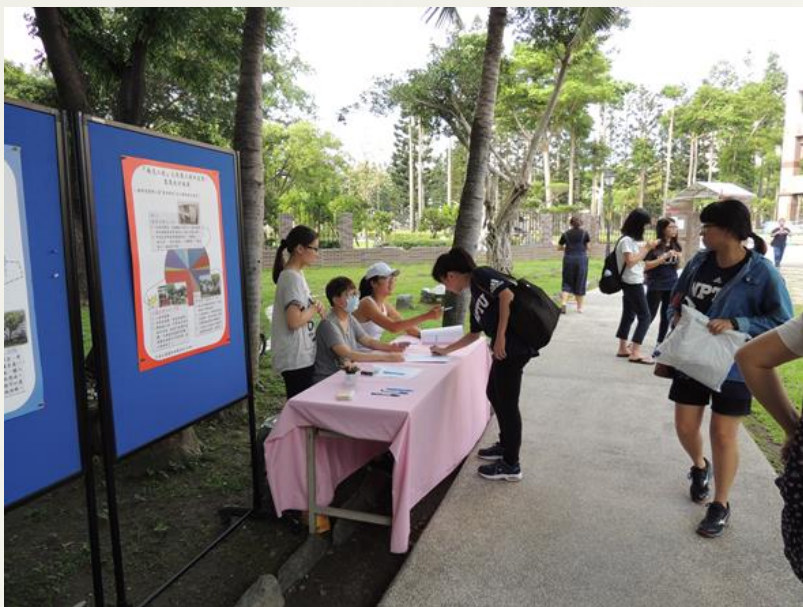
寫下對二宿的感恩與祝福