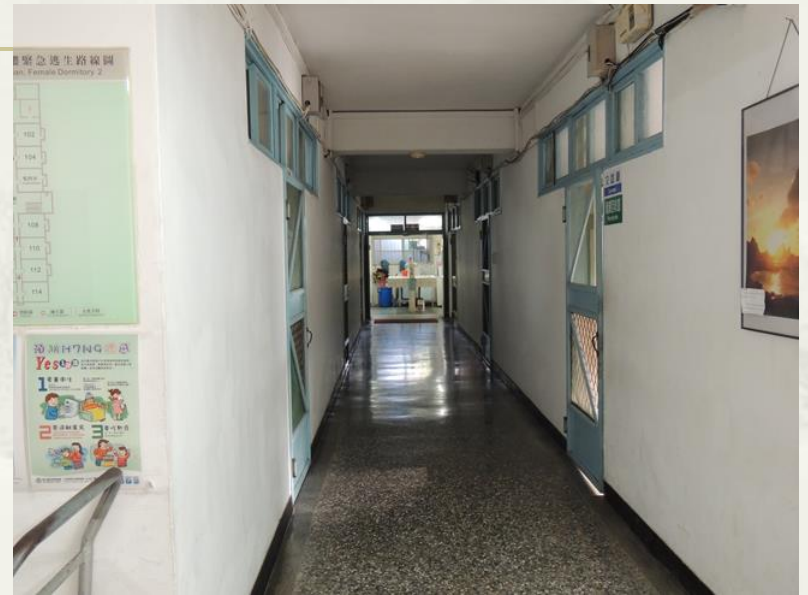
往前走 就可以洗香香