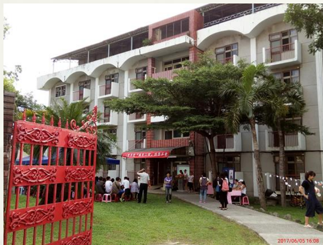
同學們一起來向二宿說再見