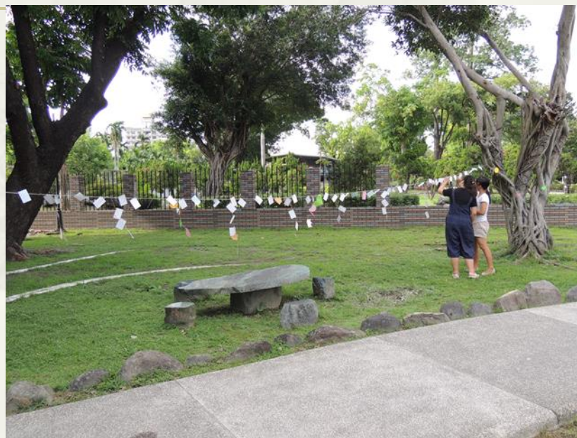
親手懸掛感恩與祝福卡